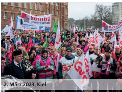
2. März 2023, Kiel

dbb: wir. für euch. 10,5% 500 Euro mindestens