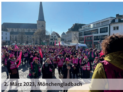
2. März 2023, Mönchengladbach