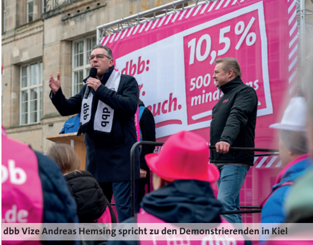
dbb Vize Andreas Hemsing spricht zu den Demonstrierenden in Kiel

Auch in Schleswig-Holstein sitzt der Frust tief bei den Beschäftigten des öffentlichen Dienstes. In Kiel gingen am 2. März 2023 erneut mehr als 1.000 Demonstrierende gegen die Ignoranz der Arbeitgeber von Bund und Kommunen auf die Straße. In Nordrhein-Westfalen führte die komba gewerkschaft landesweit Warnstreiks und Aktionen durch. In Mönchengladbach protestierten hunderte Kolleginnen und Kollegen gegen das unzureichende Angebot der Arbeitgeber.