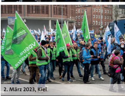
2. März 2023, Kiel